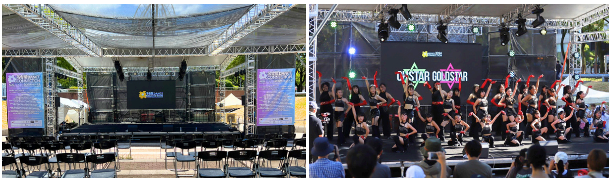
30名 ステージオンの状態